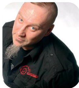
Artur Krajewski - polski malarz. Ukończył Wydział Grafiki ASP w Warszawie.