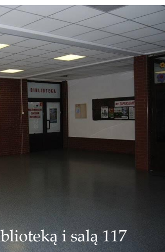
bioteką i salą 117