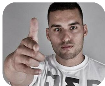
Krystian Brzeziński (Jongmen) - raper, reprezentuje Żyrardów i DIIL GANG.