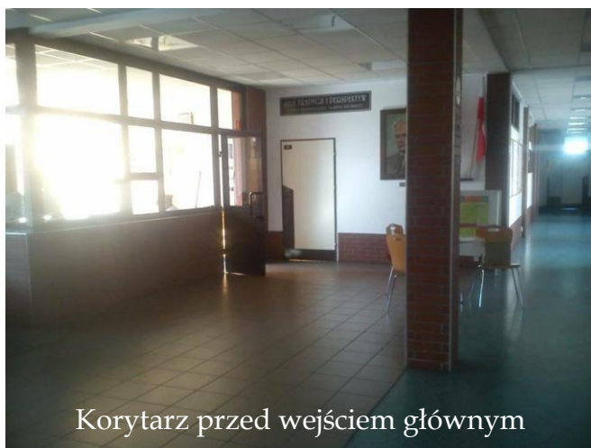
Korytarz przed wejściem głównym