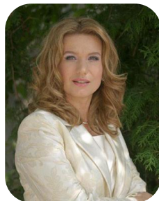
Joanna Trzepiecińska - aktorka teatralna, filmowa i telewizyjna, wokalistka.